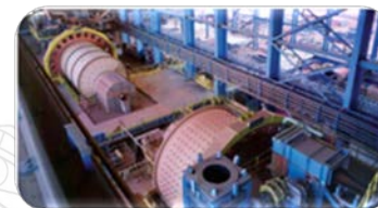
Tratamento de minérios