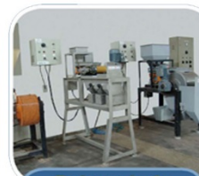
Tratamento de Minérios e Resíduos Industriais (LTM)