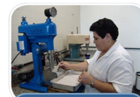
Físico-Química de Interfaces (LQFI)