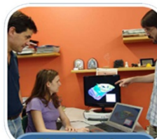
Planejamento e Otimização de Lavra (LAPOL)