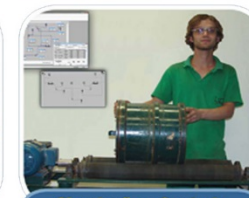
Simulação e Controle de Processos de Trat. de Minérios (LSC)