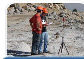
Controle Ambiental, Higiene e Segurança na Mineração (LACASEMIN)