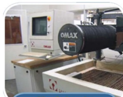
Mecânica de Rochas (LMR)