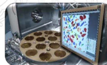
Caracterização de minérios