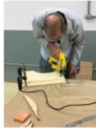
Cortes de madeira