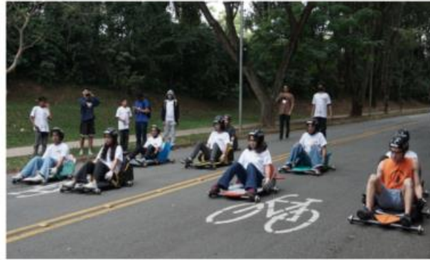
Meninos e meninas prontos para testar protótipos na ladeira da USP