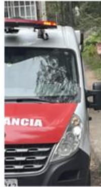
Veículos de apoio para teste dos protótipos: vans, caminhão e ambulância