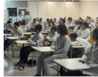
Apresentações e orientações sobre segurança