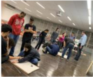
Reuniões para preparação dos monitores