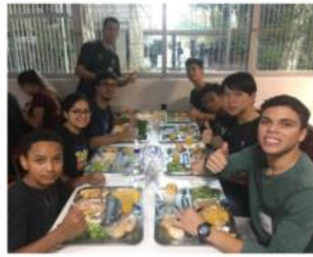
Almoço no Restaurante Universitário da USP, momento de integração entre os alunos, monitores e o ambiente USP